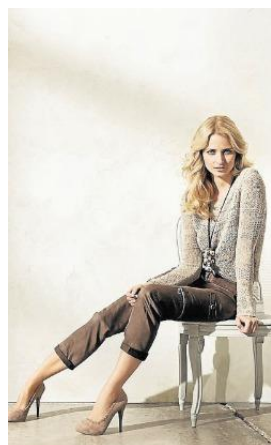
Eva Padberg posiert für Betty Barclay.