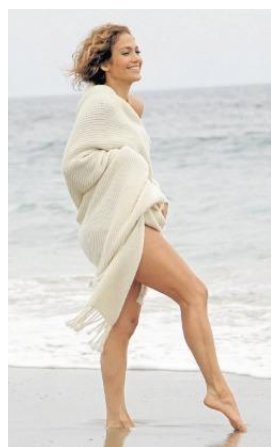
Jennifer Lopez zeigt schöne, rasierte Beine.