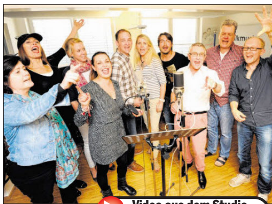
Video aus dem Studio www.express.de/tv