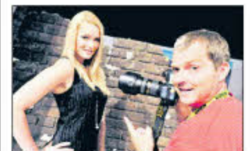
Bei der photokina professionals gibt es wertvolle Tipps und Tricks von Profis.